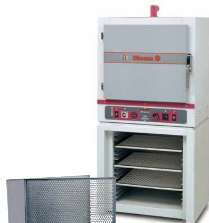
FOS 200 + MP 200

The enamel dispenser DIS can be fitted with a wide range of syringes (10-30-60 cc) connectors, joints and needles (from 0,5 to 1,6 mm diameter) for the various applications. The piece of equipment is completed with 3 enamelling paddles: inclined, straight and L shaped.