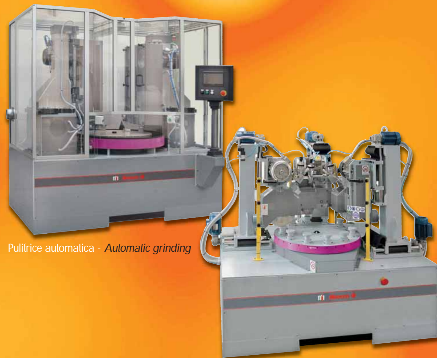
Pulitrice automatica - Automatic grinding