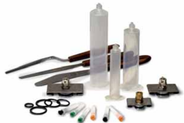
Kit siringhe - Kit of syringes